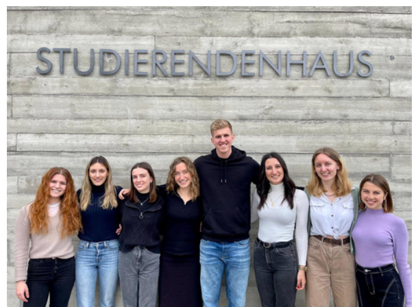
Der Vorstand des IRM network e.V.