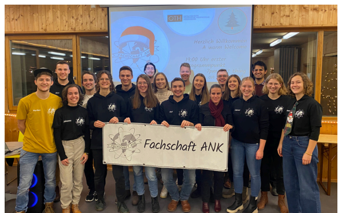
Die Fachschaft ANK