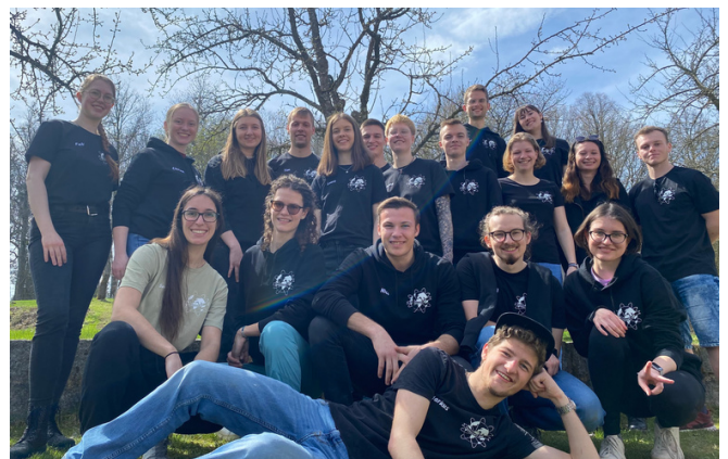
Die Fachschaft ANK